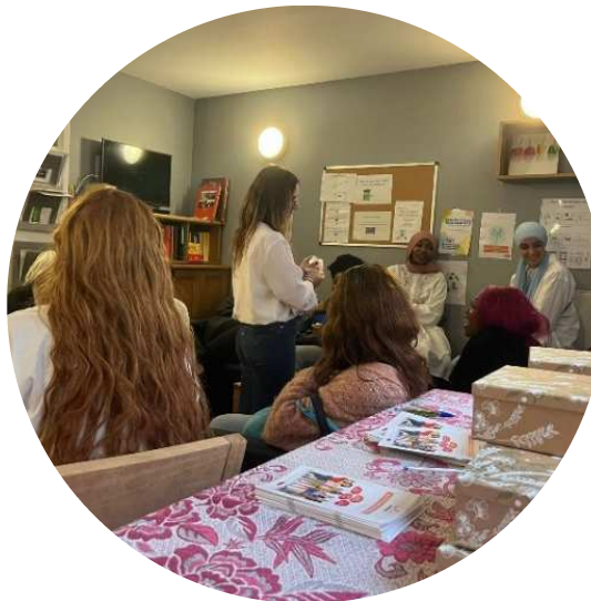
Centre d'hébergement Corot Entraide (Paris)