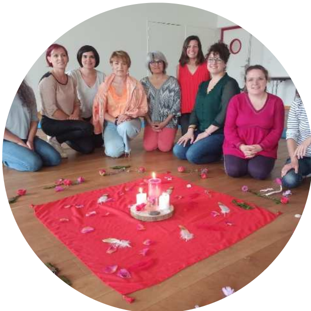
Association régionale des socio-esthéticiennes (Nantes)

des ateliers de sensibilisation sur les règles . Une belle occasion d'informer et de sensibiliser les femmes qui le souhaitent. Merci à MAY, Kiff Ton Cycle et aux professionnels de la santé pour leurs sensibilisations.